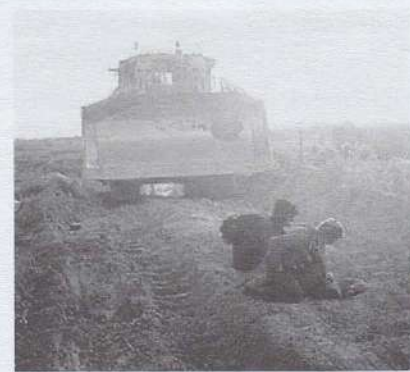
La ruspa che abbatte

Per contattare i volontari in Terra Santa: tel. 00972 67382452 Segreteria Operazione Colomba in Italia: tel. 0541 751498 e-mail: opcol@apg23.org