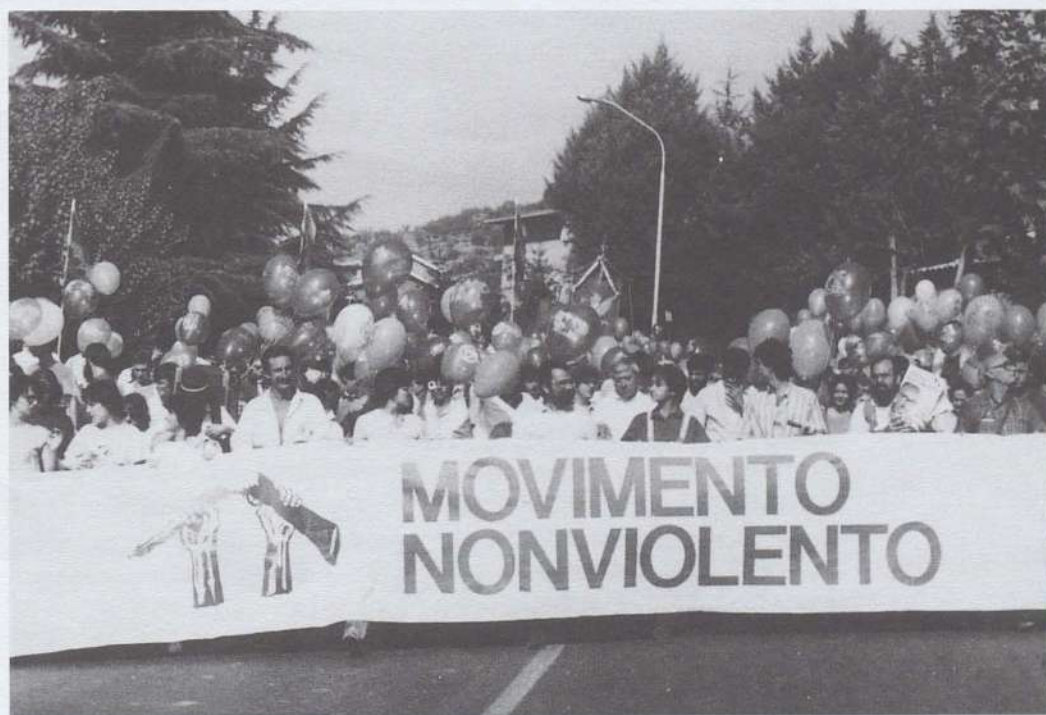
Movimento Nonviolento... in cammino

* Segretario nazionale del Movimento Nonviolento